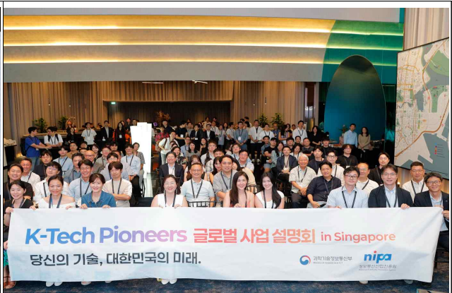
K-테크 파이오니어즈 싱가포르 사업 설명회